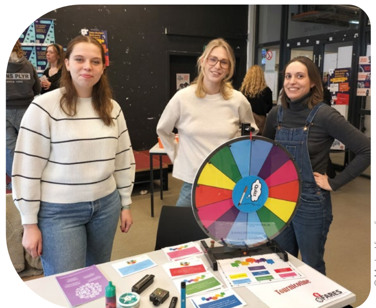
Le stand du FARES

Ces produits hyper marketés à destination des jeunes, avec des lumières qui tournent, fluo, jaune ou rose sont en démonstration au stand « Tournicotine » du FARES. Deux étudiantes tentent leur chance sur le quizz « Vrai ou Faux ». À la première affirmation : « on ne peut pas être accro à la puff », l'une d'elle s'exclame avec beaucoup d'assurance. « c'est vrai parce que dans certains puffs, il n'y a pas de nicotine ! » Son amie semble moins sûre. Ce qui permet de détailler les trois types de dépendance : physique (à la nicotine), psychologique et comportementales/sociales.